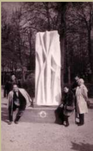
La Passante, par Yerassimos SKLAVOS , 1965