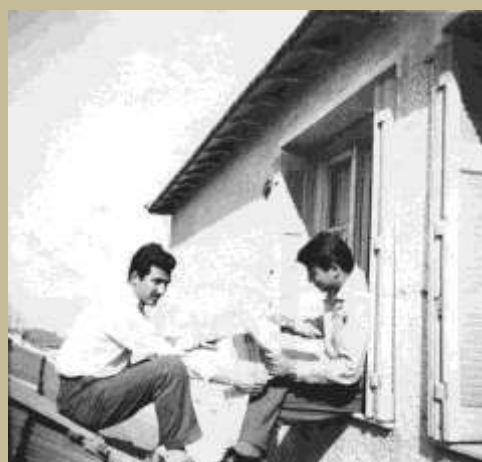
Sur le toit du lycée